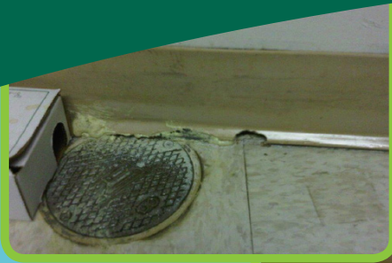
Izquierda: Agujero de raton con un trampa de caja cerca.